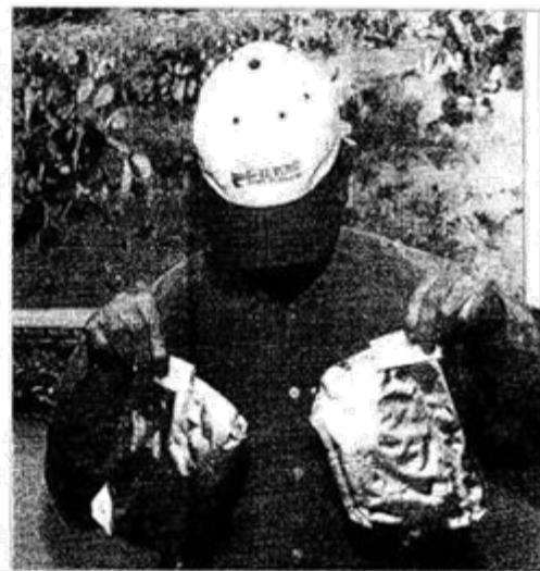
El agricultor muestra un pesticida que también está prohibido, el "isofenfos-metilo", que siempre se usa en la comercialización.

Según el informe, este pesticida es muy tóxico y puede causar cáncer. En el momento de la venta, los agricultores no sabían que estaba prohibido en España pero sí en el resto de Europa. Desde entonces, se